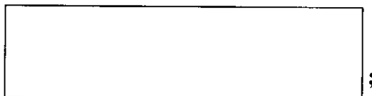
Схема границы балансовой принадлежности

е) границей эксплуатационной ответственности объектов централизованной системы водоотведения Организации водопроводно-канализационного хозяйства и Заказчика является: